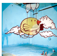
Graff réalisé par Tabas avec la collaboration d'Elsa Guérin, dans l'ancienne piscine municipale de la Ville de Riom, pour le film Oiseau .

4 films courts ont ainsi été réalisés. Le premier est un film d'animation, inspiré de notre univers du jonglage et de ses objets. Le second est une séquence de DJ'ing (art du DJ) avec des body tricks , le troisième est une performance de la réalisation d'un graff au fond d'une piscine désaffectée, mise en scène dans un esprit de fiction (scénarisation de l'intervention des personnages dans ce lieu fermé), et le dernier est une sorte de clip inspiré de l'univers du manga, où l'on retrouve des personnages cagoulés (comme dans les films précédents) en action dans des lieux saugrenus (notamment en milieu rural).